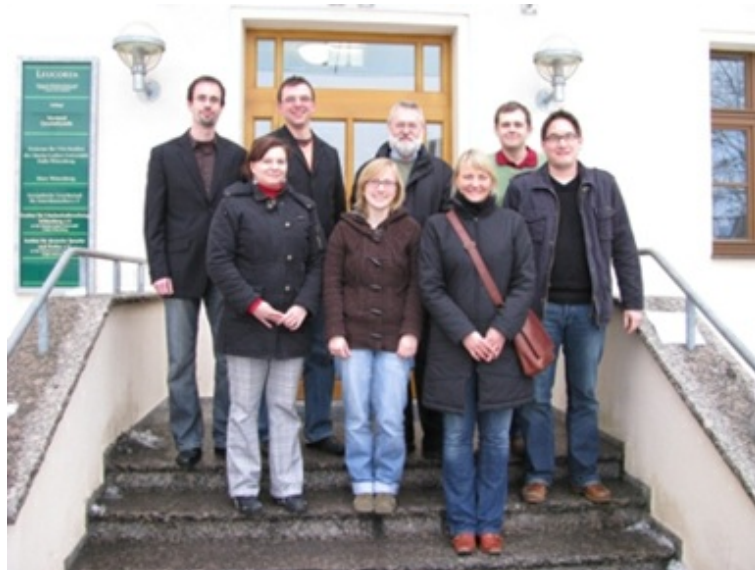
Teilnehmer des Studentenseminars

Am 15. und 16.1.2009 führt der Lehrstuhl in der Leucorea Wittenberg ein Seminar zum Thema "Airline and Airport Management" Studierende der Vertiefungsrichtung "Operations Research" durch. ( https://www.mansci.ovgu.de/mansci_media/chronik/2009/daten/ablaufplanwittenberg.pdf )