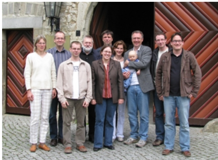
Teilnehmer des Doktoranden-Workshops

> (weitere Fotos) ( https://www.mansci.ovgu.de/Chronik/2008/Doktorandenseminar.html )