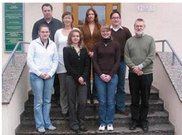
Teilnehmer des Studentenseminar

Am 17. und 18.1.2008 veranstaltet der Lehrstuhl "BWL VIII - Management Science" ein Seminar ( https://www.mansci.ovgu.de/mansci_media/chronik/2008/daten/seminar.pdf ) über "Moderne Heuristiken" für Studierende der Vertiefungsrichtung "Operations Research". Tagungsort ist die Leucorea, die alte Wittenberger Universität. Die Teilnehmer haben nicht nur die Möglichkeit, sich mit Methoden wie dem Attribute-Based Hill Climbing oder der Ant Colony Optimization vertraut zu machen, sondern auch die Lutherstadt kennen zu lernen, die schon seit einigen Jahren zum Weltkulturerbe der UNESCO gehört.