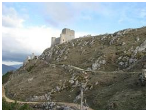
Tagungsort Sala Calesstiniana (oben), Rocca Calascio (unten)